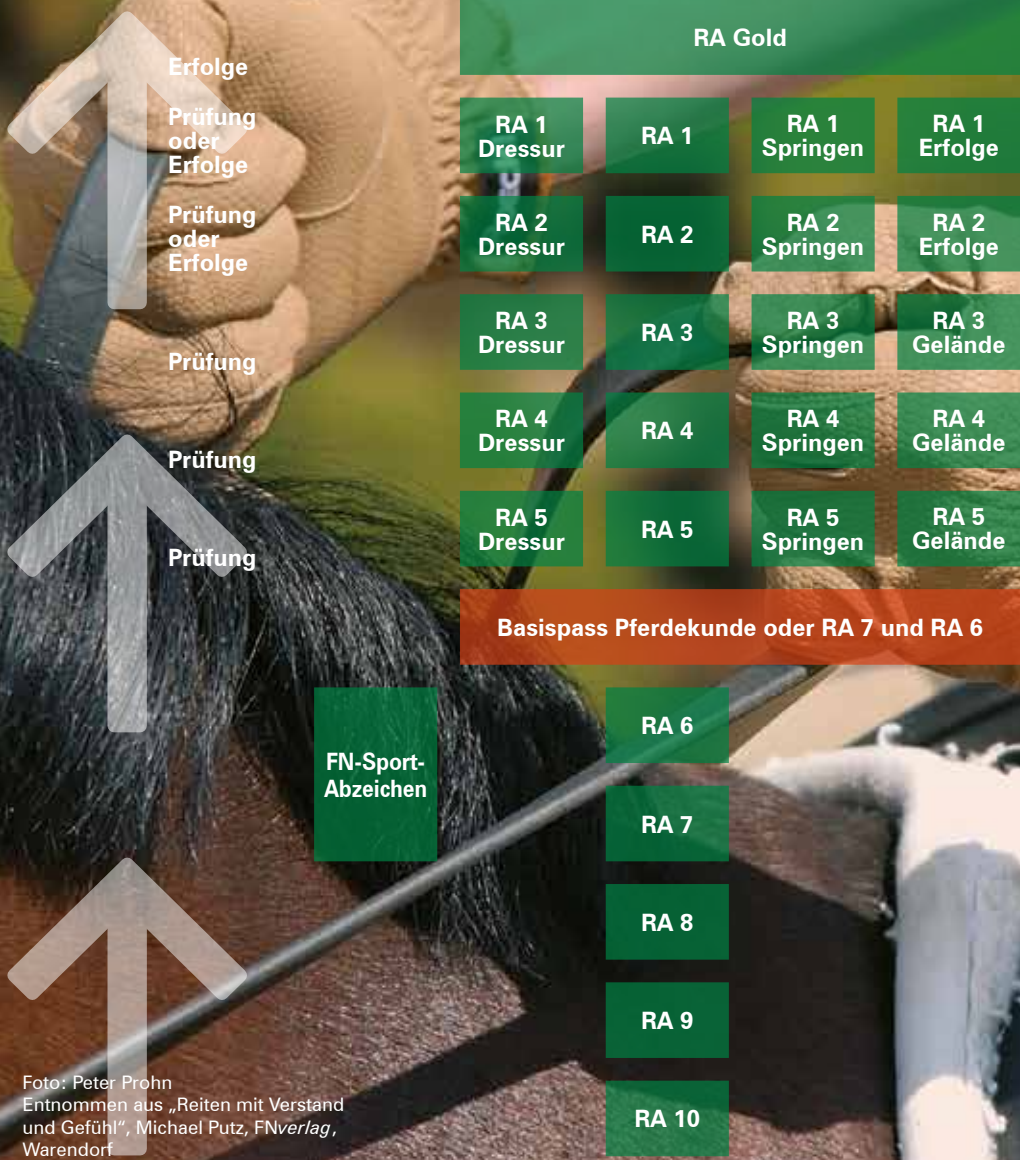
Foto: Peter Prohn Entnommen aus „Reiten mit Verstand und Gefühl“, Michael Putz, FNverlag, Warendorf